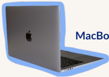
MacBook Air M4