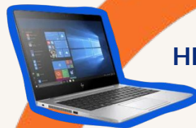
HP EliteBook 830