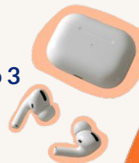
AirPods Pro 3