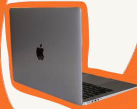
MacBook Air M1