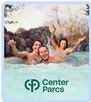
Séjour Center Parcs pour 4 personnes