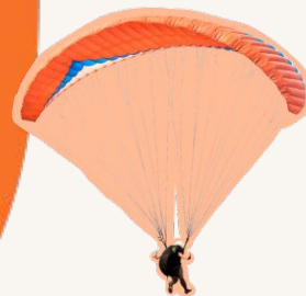
Baptêmes de parapente