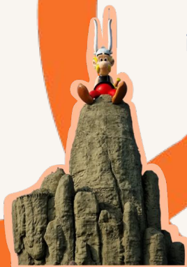
4 places au Parc Astérix