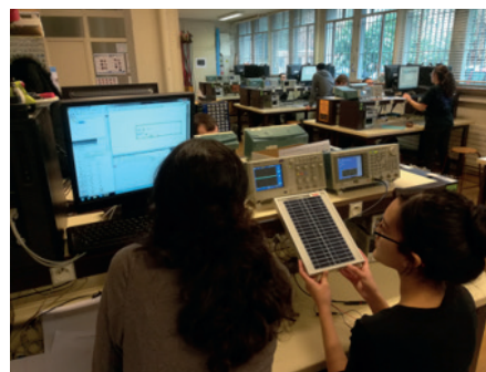
Étudiants en salle de TP d'électronique.